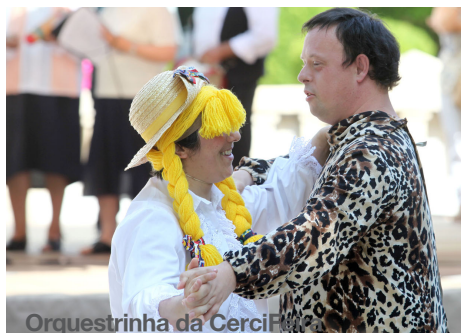
Orquestrinha da Cercia