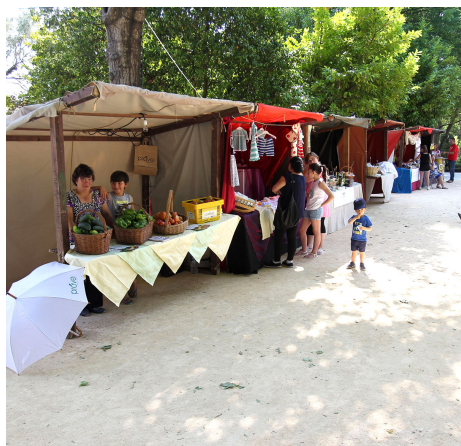
mostra de produtos locais