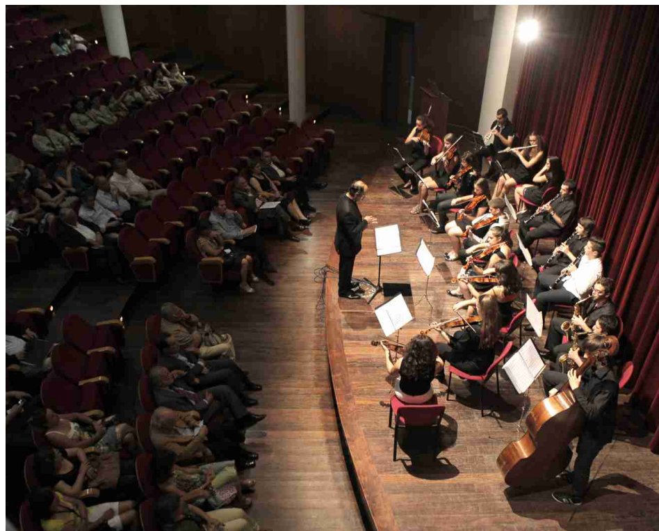
Cerimónia de Abertura